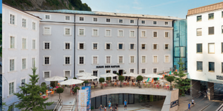
Haus der Natur - Museum für Natur und Technik