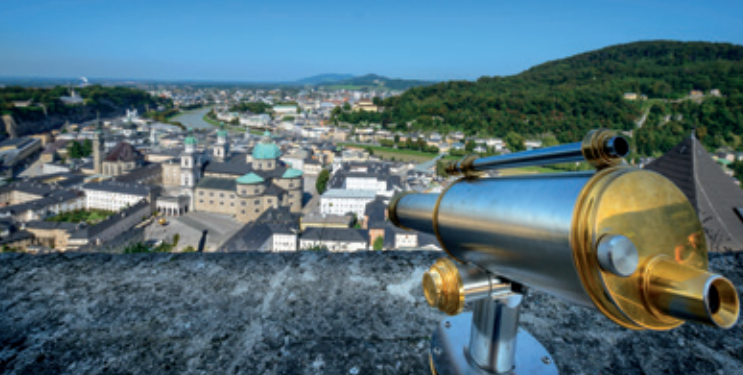
Blick vom Mönchsberg auf die Altstadt