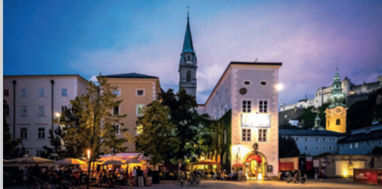
Museum der Moderne Salzburg – Altstadt (Rupertinum)